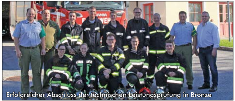
Erfolgreicher Abschluss der technischen Leistungsprüfung in Bronze