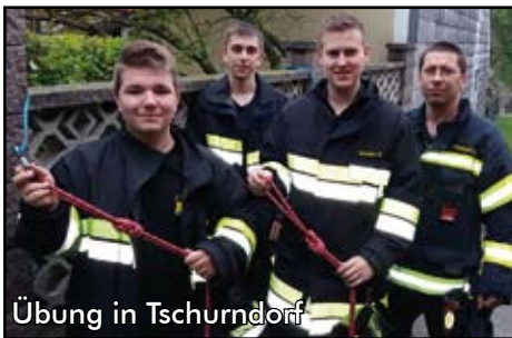
Übung in Tschurndorf