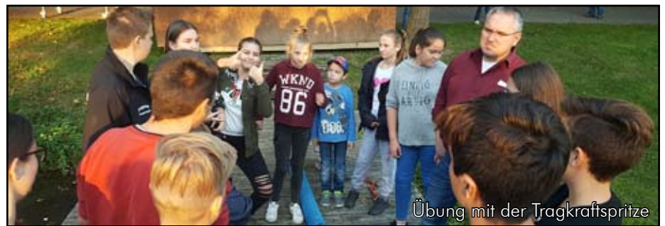
Übung mit der Tragkraftspritze