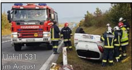
Unfall S31 im August