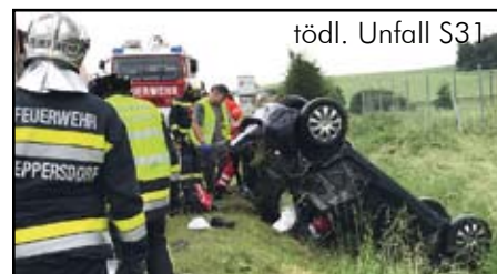
tödl. Unfall S31

Im Baustellenbereich der S31 bei der Auffahrt Siegraben kam es am 23. Mai zu einem schweren Unfall, bei dem zwei Fahrzeuge frontal ineinander krachten. Auch hier musste die Lenkerin mittels Schere und Spreizer von der Feuerwehr Weppersdorf befreit werden, bevor sie mit dem Notarztthubschrauber Christopherus 3 ins Krankenhaus gebracht wurde. Spektakulär endete auch ein Lkw-Unfall auf der S31 bei Neutal, als ein Lkw einen Asfinag Lkw übersah und in diesen krachte. Zwei Menschen wurden dabei verletzt und die Feuerwehr Weppersdorf stand auch hier im Einsatz.