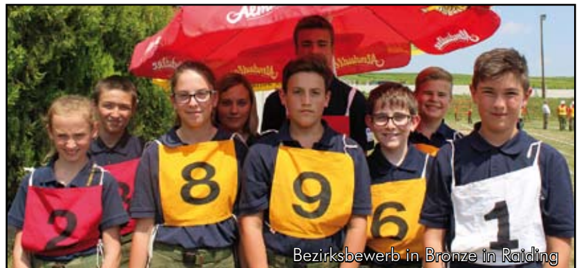
Bezirksbewerb in Bronze in Raiding