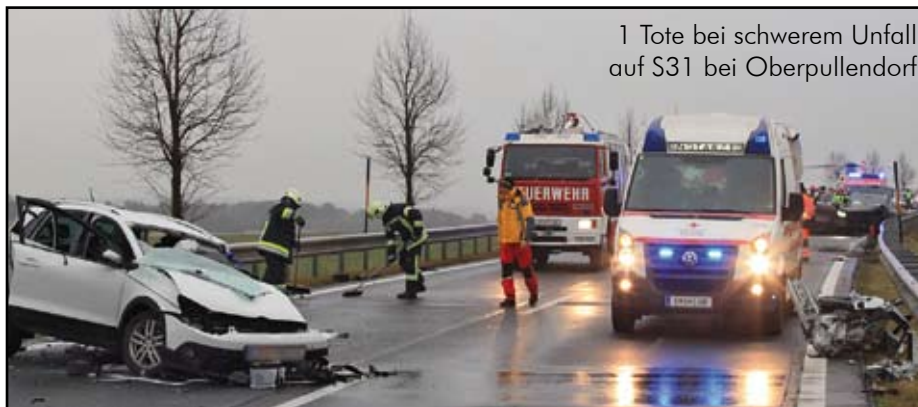
1 Tote bei schwerem Unfall auf S31 bei Oberpullendorf