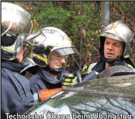
Technische Übung beim Übungstag

Mindestens einmal im Monat wird geübt. Nur so können wir im Einsatzfall schnell, effizient und richtig helfen.