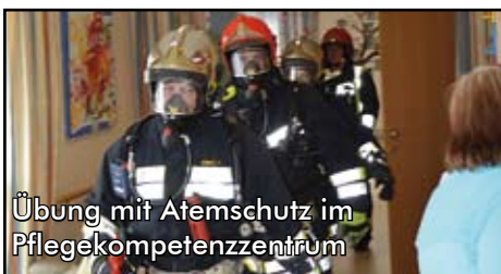
Übung mit Atemschutz im Pflegekompetenzzentrum

Übungen und Leistungsbewerbe stellen einen wichtigen Grundpfeiler einer funktionierenden Feuerwehr dar - so freilich auch in Weppersdorf. Ob bei einer gemeinsamen Übung mit dem Arbeitersamariterbund im Pflegekompetenzzentrum Weppersdorf, bei der Inspizierungsübung in einer Werkstättenhalle am Ortsrand von Weppersdorf oder aber beim Übungstag - die Mitglieder der Feuerwehr Weppersdorf absolvierten im abgelaufenen Jahr insgesamt 34 Übungen und zwei Schulungen (stand Ende November) im Feuerwehrhaus. Außerdem wurden 19 Lehrgänge an der Landesfeuerweherschule besucht - ein Zeichen für die ständige Bereitschaft zur Aus- und Weiterbildung unserer Feuerwehrmitglieder.