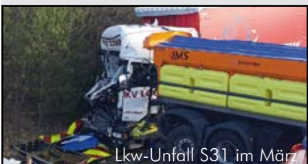
Lkw-Unfall S31 im März