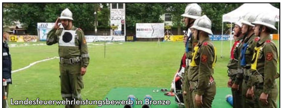
Landesfeuerwehrleistungsbewerb in Bronze

Der Herbst wurde genutzt, um sich im Bereich des technischen Einsatzes weiterzubilden - bei der technischen Leistungsprüfung in Bronze . Dabei wird ein simulierter Verkehrsunfall von zehn Florianis gemeistert und die eingeklemmte Person befreit. Außerdem wird das Wissen der Feuerwehrmitglieder zu einzelnen Feuerwehrgeschäften intensiv überprüft.