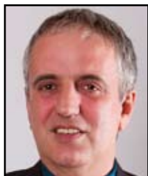
Erich Zweiler Bürgermeister

Auch 2017 war euer Engagement, eure Bereitschaft für die Gemeinschaft da zu sein, vorbildlich. Viele Stunden eurer Freizeit für Weiterbildung, Übungen, aber auch für Einsätze, hauptsächlich technische Einsätze, habt ihr für die Allgemeinheit zur Verfügung gestellt.