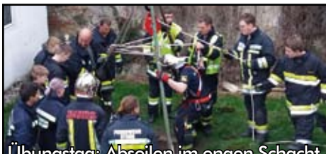
Übungstag: Abseilen im engen Schacht